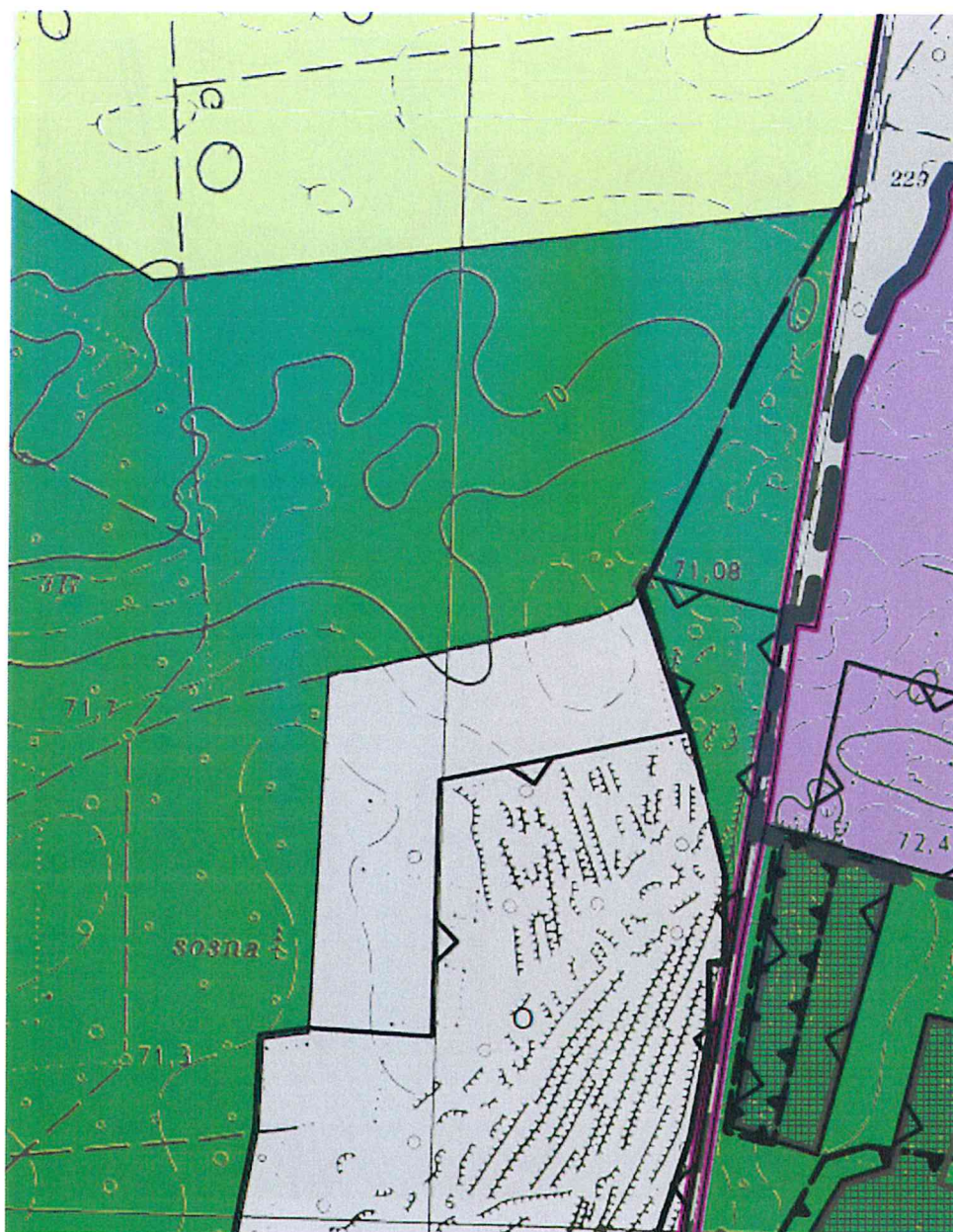
Rys.1. Wyrys z rysunku Studium przed zmianą