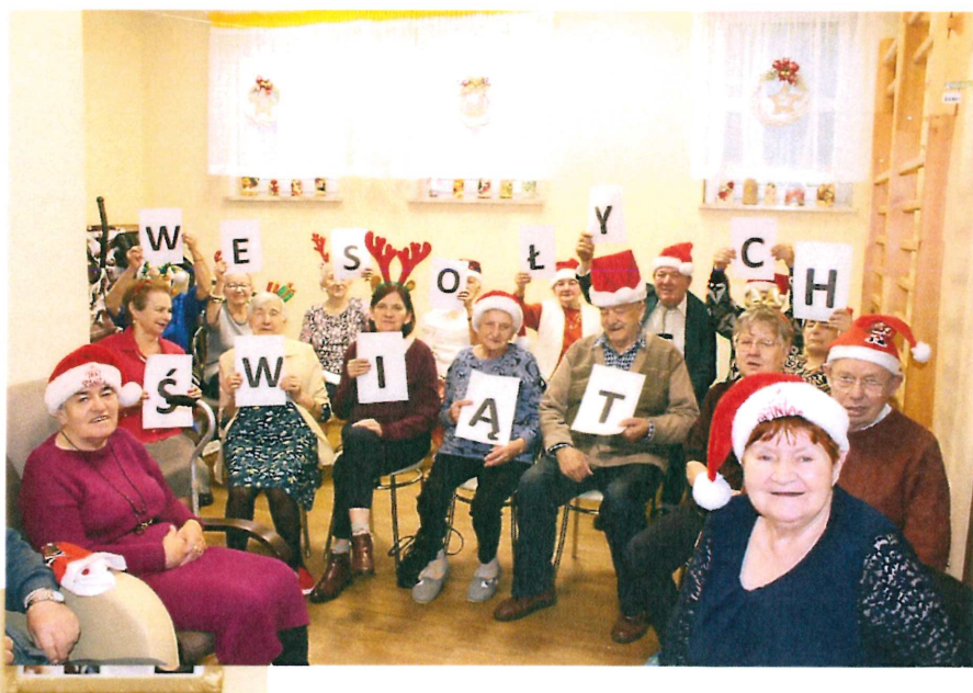
Foto nr 37 Przygotowania do Świąt