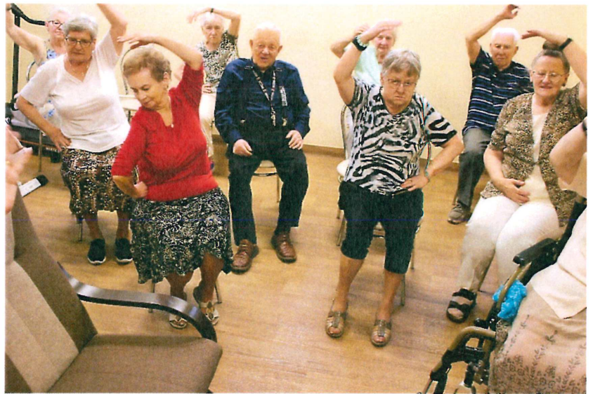
Foto nr 2 Gimnastyka poranna