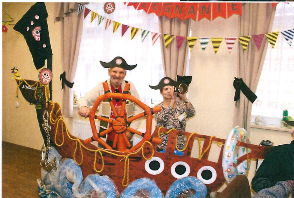
Foto nr 23 DZIEŃ PIRACKI POŻEGNANIE