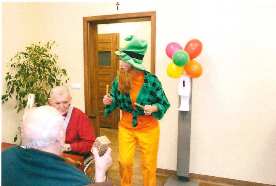
Foto nr 9 Wspólna gra na instrumentach