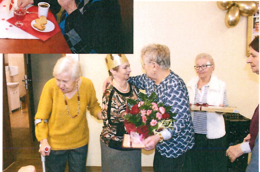
Foto nr 8 Urodziny Seniorki