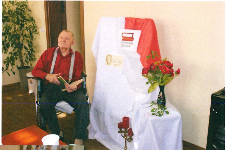
Foto nr 31 NARODOWE CZYTANIE