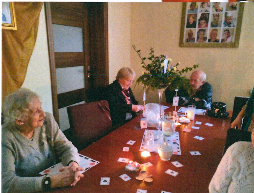
Foto nr 32 ANDRZEJKI