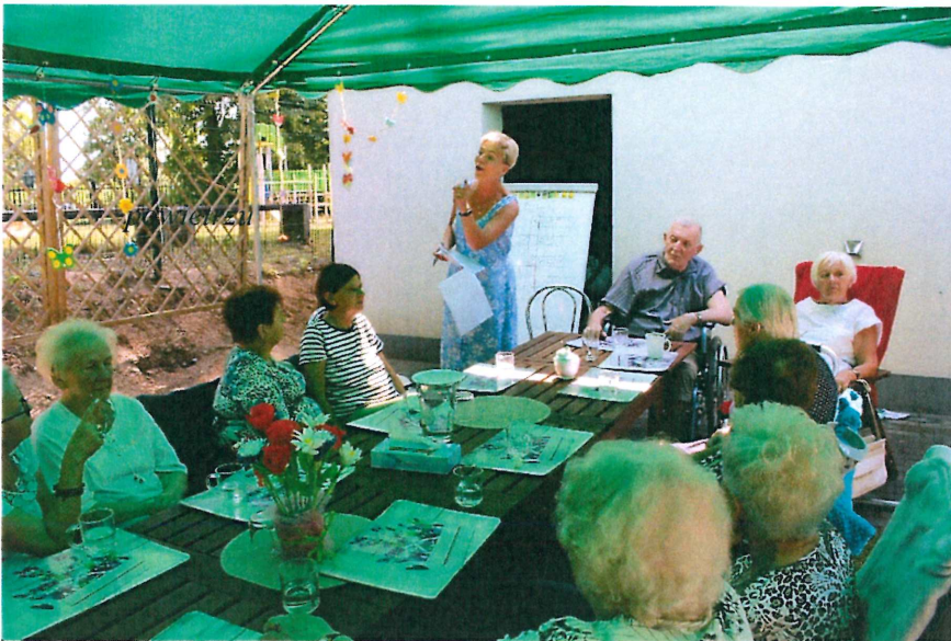
Foto nr 4 Zajęcia na świeżym