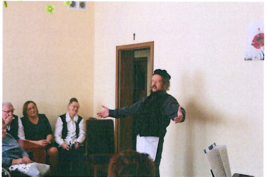
Foto nr 22 Występ grupy ARTE PER NOI z Bydgoszczy