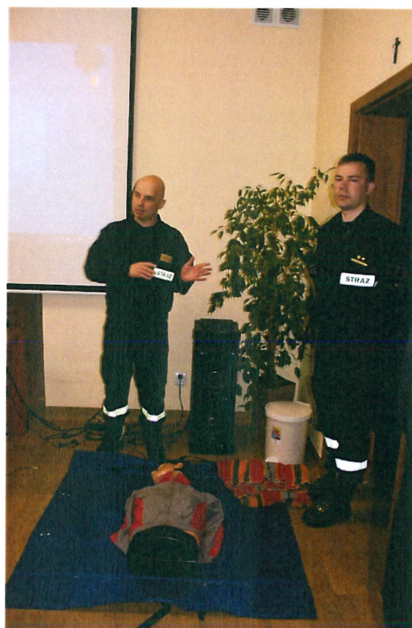
Foto nr 17 Prezentacja przedstawicieli Państwowej Straży Pożarnej „Udzielanie pierwszej pomocy”