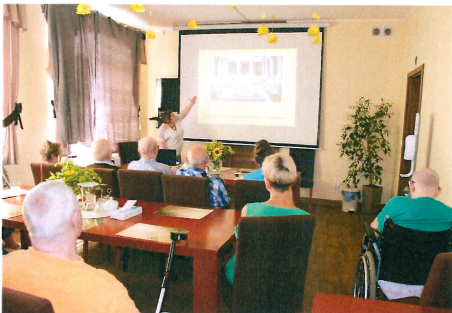
Foto nr 15 Wykład przedstawiciela Ministerstwa Sprawiedliwości „Bezpieczeństwo Seniorów”