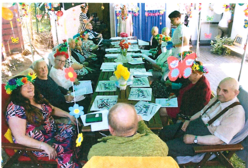
Foto nr 13 POWITANIE LATA