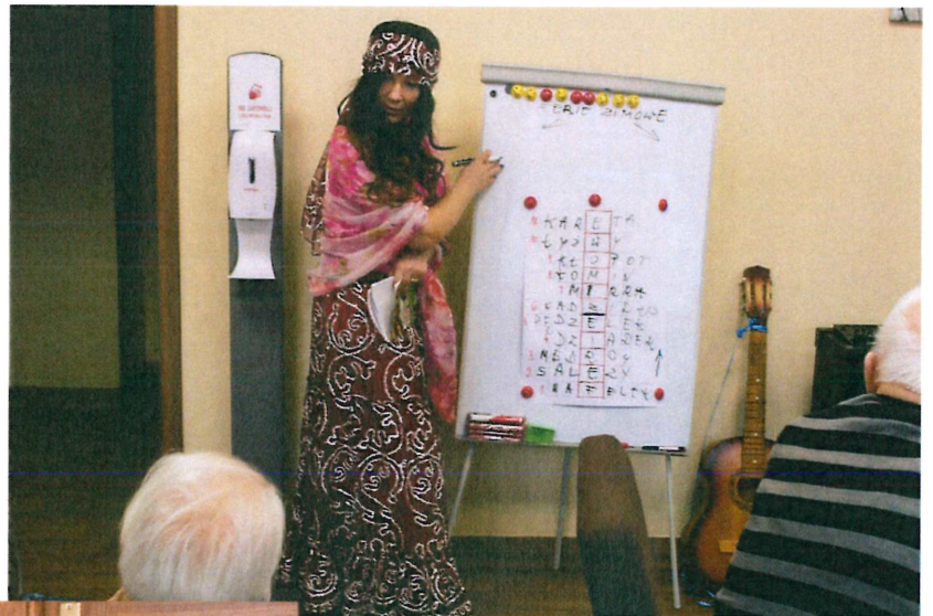
Foto nr 11 Trening umysłu na wesolo