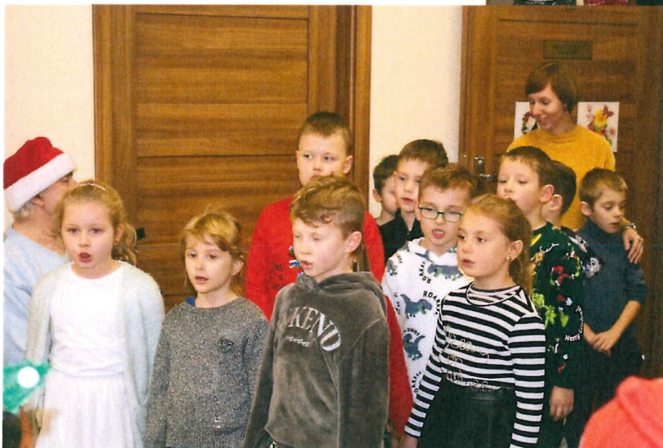
Foto 41 Wizyta dzieci z Przedszkola SŁONECZKO z Nakła n. Not.