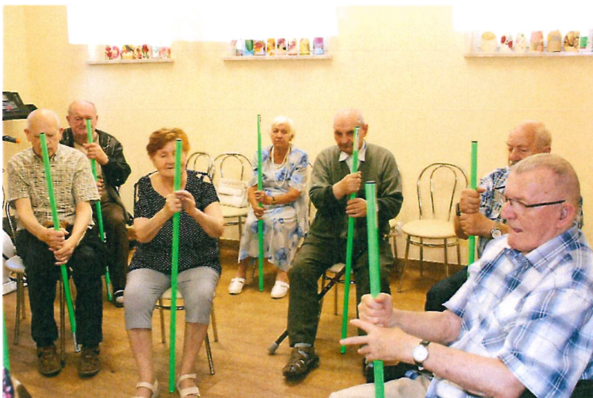
Foto nr 3 Ćwiczenia rehabilitacyjne