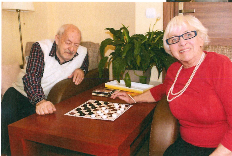
Foto nr 12 Wspólna gra w warcaby