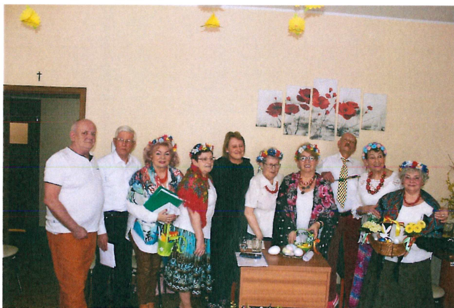
Foto nr 19 Występ Kabaretu LUZIK z NOK w Nakle n. Not.