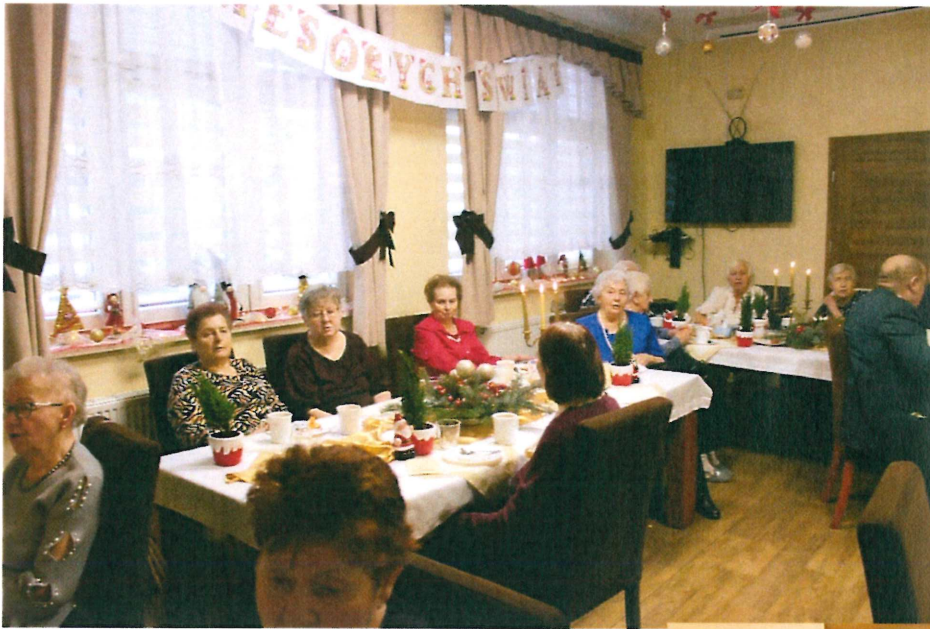
Foto nr 39 WIGILIA BOŻEGO NARODZENIA