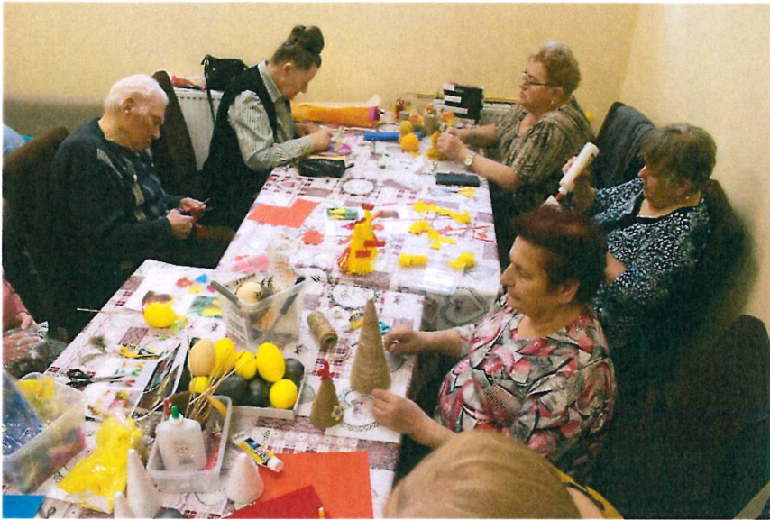
Foto nr 1 Zajęcia z arteterapii