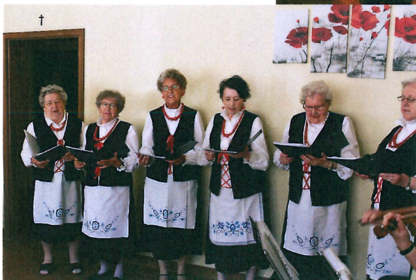
Foto nr 20 Występ Zespołu NAKIELANKI z NOK w Nakle n. Not.