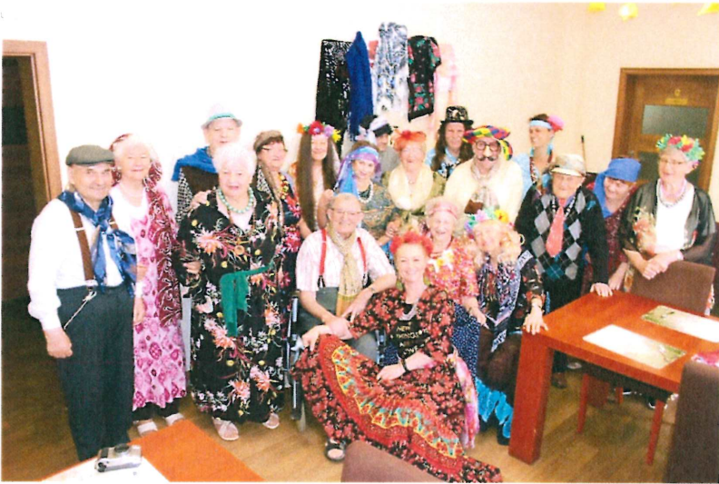
Foto nr 21 DZIEŃ CYGAŃSKI