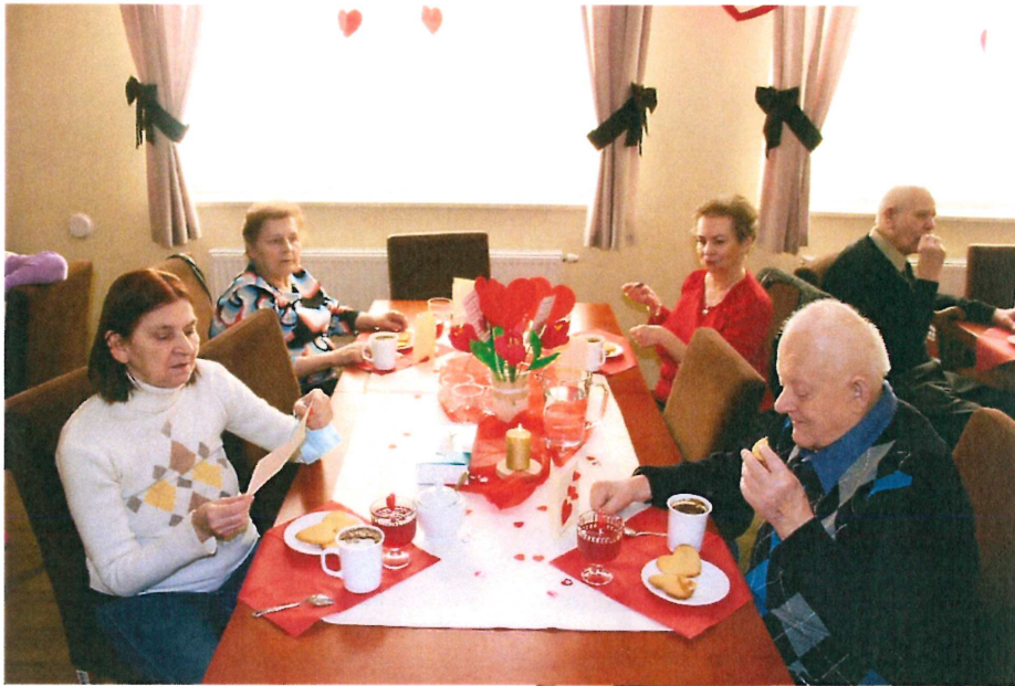
Foto nr 7 Obchody Walentynek