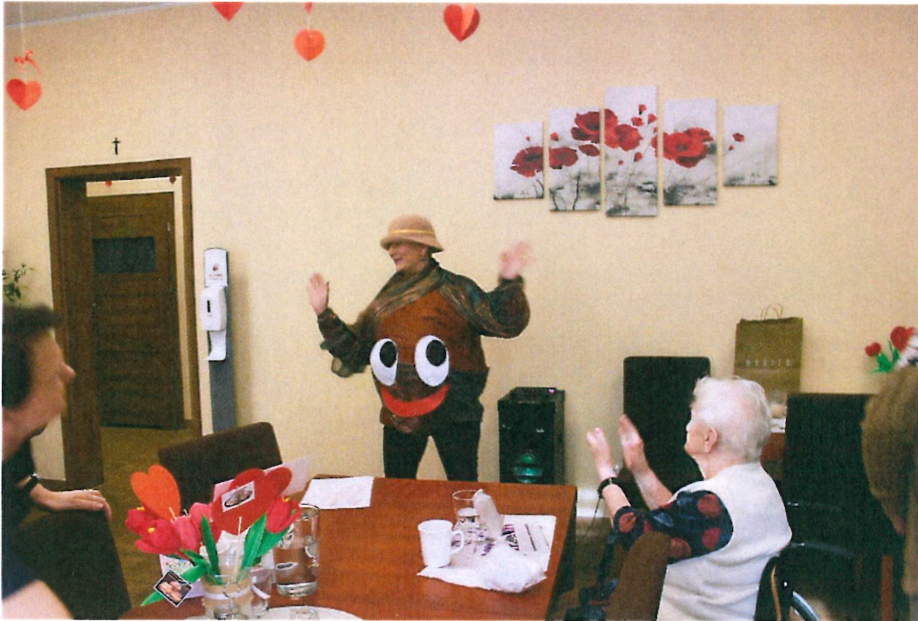
Foto nr 10 Tłusty czwartek i Wesoly Pączuś