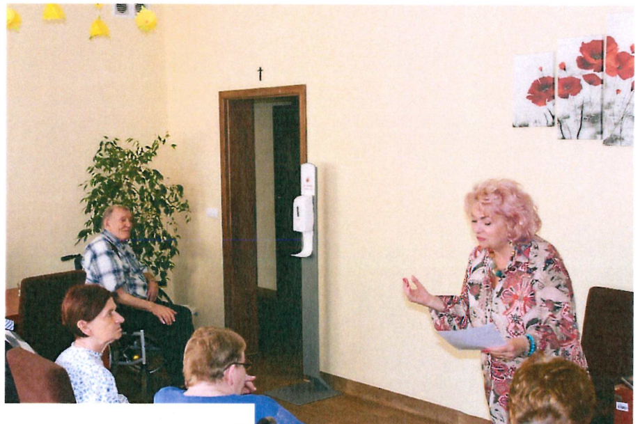
Foto nr 5 Zajęcia z Panią psycholog