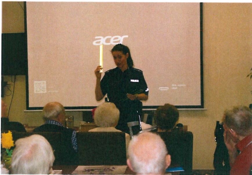
Foto nr 16 Prezentacja przedstawicieli Policji dot. Bezpieczeństwa Seniorów i unikania zagrożeń