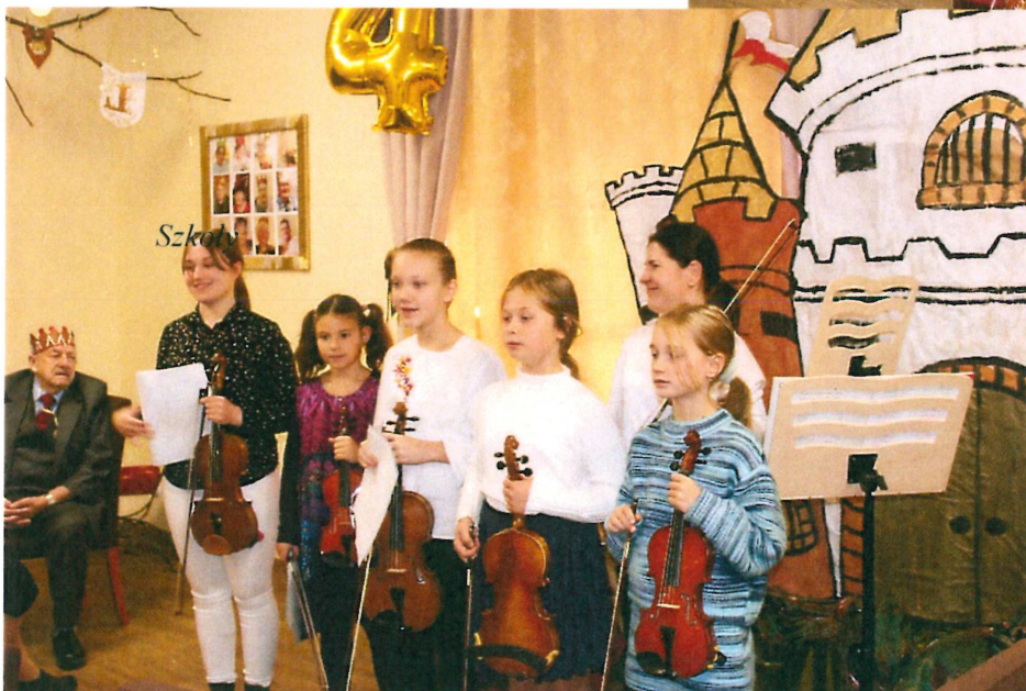
Foto nr 29 Występ dzieci ze Muzycznej I Stopnia w Nakle n. Not.