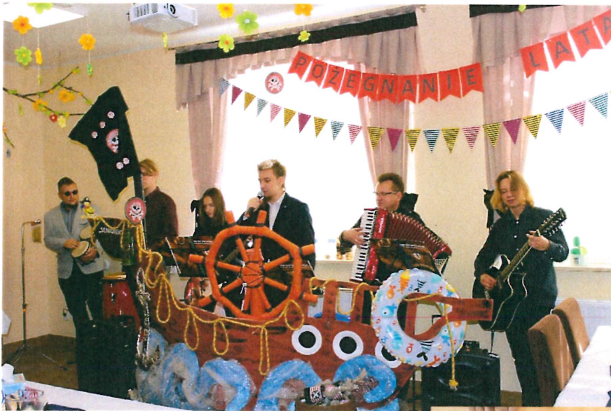
Foto nr 27 Występ zespołu KOTWICA W GÓRĘ z Zespołu Szkół Żeglugi Śródlądowej w Nakle n.Not.