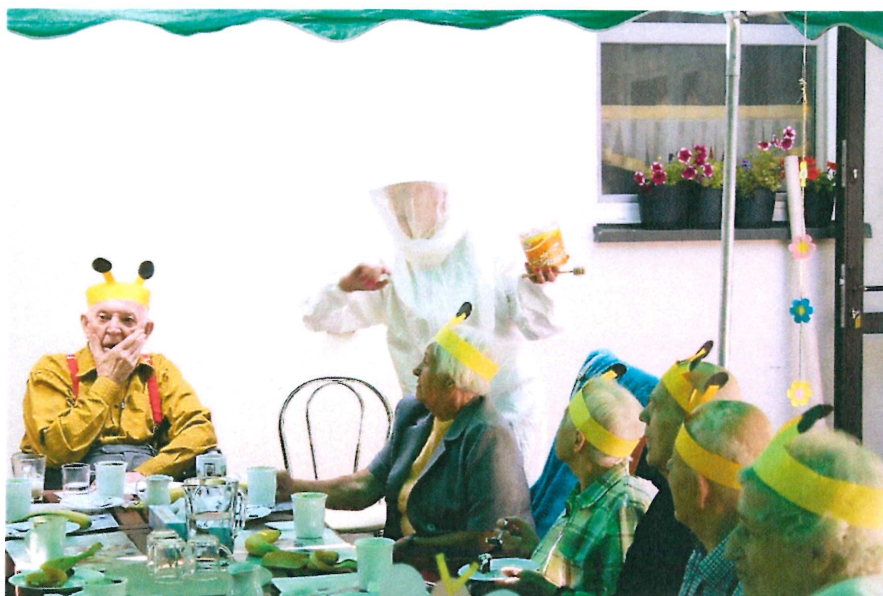
Foto nr 18 DZIEŃ PSZCZOŁY