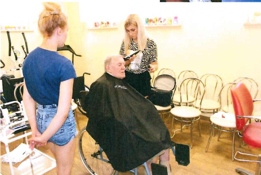
Foto nr 6 Usługi fryzjerskie