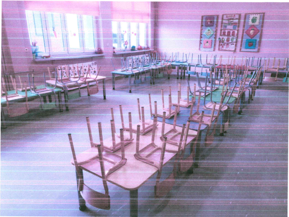
Zespół Szkolno-Przedszkolny w Paterku: