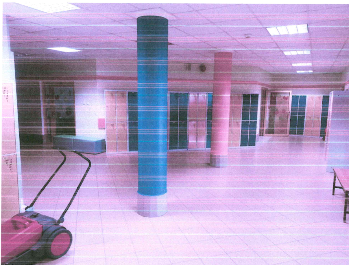
Zespół Szkolno-Przedszkolny w Potulicach: