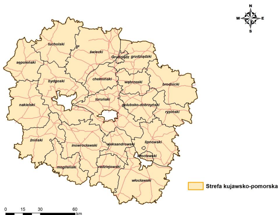
Rysunek 1 Strefa kujawsko-pomorska

Strefa kujawsko-pomorska położona jest w północno-środkowej części kraju. Obejmuje obszar o powierzchni ok. 17 596 km 2 . Według danych GUS z 2015 roku w strefie mieszkało 1,4 mln mieszkańców. W strefie znajduje się 49 miast. Strefa kujawsko-pomorska graniczy z województwami: pomorskim, warmińsko-mazurskim, łódzkim i wielkopolskim.